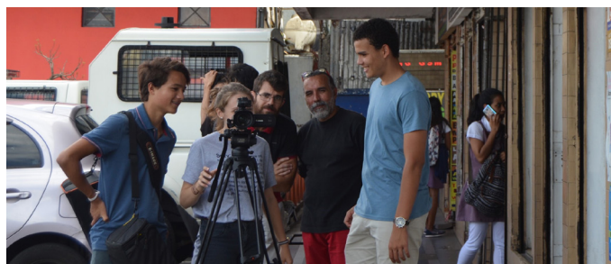
Tournage dans une rue de Rose-Hill