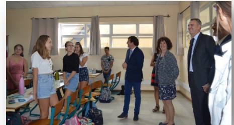
L'Ambassadeur et la délégation ont eu l'occasion d'échanger avec les élèves et les personnels