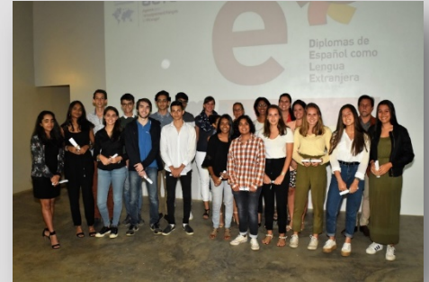
Les élèves ayant brillamment réussi la certification DELE en mai dernier