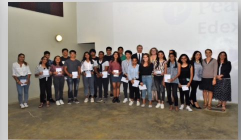
Nos élèves posent fièrement avec leur diplôme