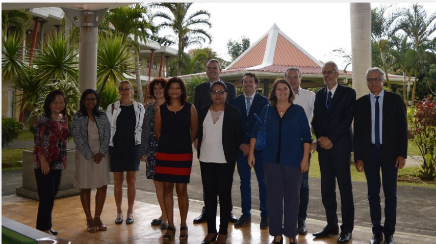
La délégation diplomatique, le Proviseur, son adjointe, le Président du Comité de Direction ainsi que quelques membres du personnel réunis pour une photo souvenir