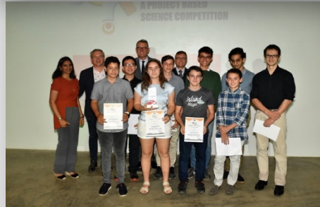
Les gagnants du concours Science Quest (catégorie supérieure) en compagnie des élèves du Collège Pierre Poivre (3 e prix catégorie 12-15 ans)