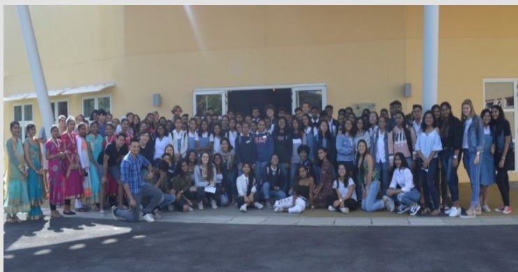
Our guests from the MGI were warmly welcomed by our students