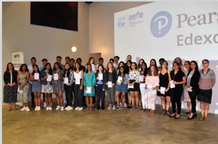
100% de réussite pour les élèves qui ont pris part aux examens de l'IGCSE