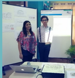
Mme Baehrel a été d'un grand soutien dans la réalisation de ce projet