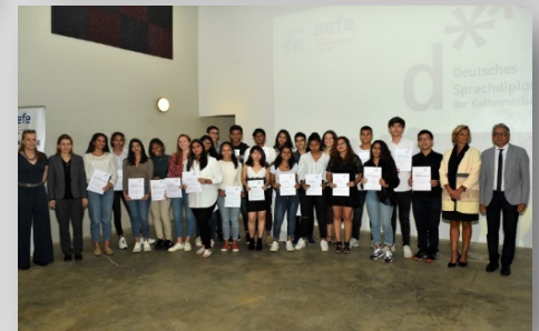
La belle performance des élèves au Deutsches Sprachdiplom der Kulturministerkonferenz a aussi été saluée