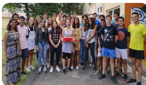
La classe de TSB a pris la deuxième place