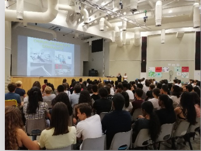
Les conférences ont fait salle comble