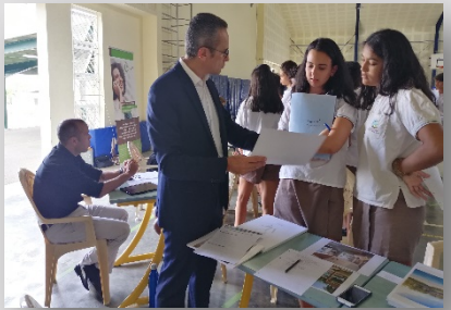
Des professionnels de tout secteur ont exposé aux élèves la réalité de leur métier