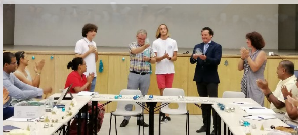
Les vice-présidents des deux CVL ont remis symboliquement un trophée CVL aux deux proviseurs