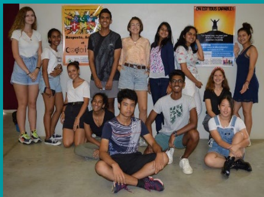
Les membres du Club des Droits humains

La semaine du respect a démarré avec une conférence sur la lutte contre le racisme. Les élèves présents n'ont pas hésité à réagir et à partager leur avis et expérience sur le sujet