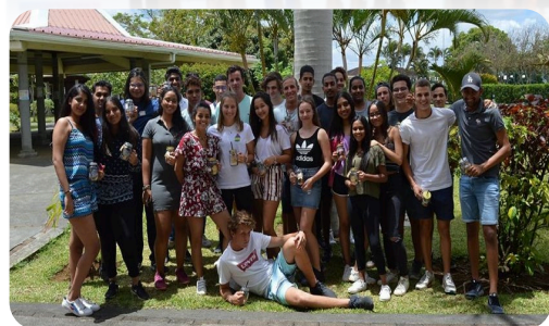
Les élèves de TSTMG ont raflé la première place au concours par classe

Grâce à son poème, Krithika Kadressa Pillay (1 re B) a décroché la troisième place