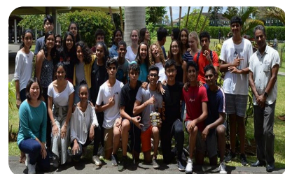
La troisième place revient à la 2 nd e Section internationale