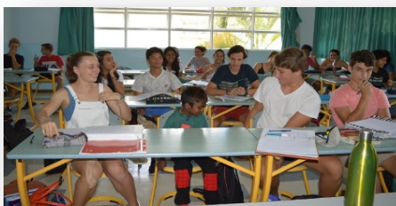
Passage des enfants dans les classes. Cette année, chaque classe était chargée d'offrir un kit de rentrée complet à chaque enfant