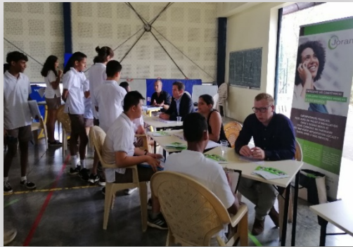
Une belle occasion pour les collégiens de rencontrer un large panel de professionnels