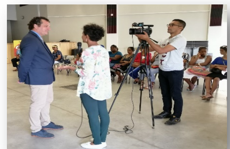
Présence d'une équipe de la télé nationale dans le cadre du tournage d'une émission spéciale intitulée « Noël avec les enfants »