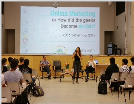
Les secteurs d'activité étaient riches et variés