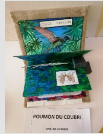
Ateliers scientifiques : « les molécules du vivant » et exposition scientifique de maquettes « Des molécules à l'organe » réalisées par les élèves de 2 nd e en tâche finale de leur chapitre