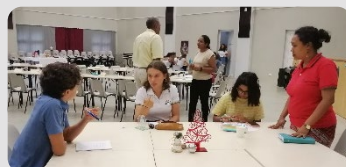
Un des objectifs du CVL Maurice est aussi de sensibiliser les élèves aux enjeux environnementaux

Atelier de travail : L'axe sportif était au cœur des discussions. Des rencontres sportives rassemblant les élèves des deux lycées seront organisées dans le courant de l'année 2020: tournoi de foot, handball, etc.