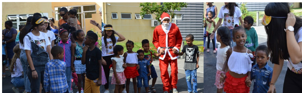
Le Club solidarité et le Père Noël ont réservé un bel accueil à nos petits invités

Un cartable neuf avec du matériel scolaire, une paire de basket... Ce n'est pas encore la rentrée scolaire pour les écoles mauriciennes, pourtant une trentaine d'enfants de la région de St-Pierre sont fin prêts pour reprendre le chemin de l'école. C'est dans le cadre de l'opération "Un sourire pour tous" initiée par le Club Solidarité que 31 enfants issus de milieux très modestes ont reçu un cartable offert par les élèves du Lycée des Mascareignes. Le 16 décembre, ces enfants ont été invités à célébrer Noël au lycée où un goûter et des activités étaient organisés en leur honneur. Cette matinée aura été une belle occasion de partage pour nos élèves qui se sont bien investis dans ce projet, chapeauté par Mme Fin.