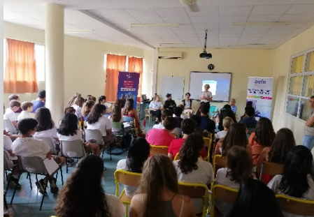
Des conférences et présentations ont été proposées cette année