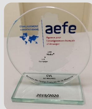
Un trophée à l'effigie du CVL Ile Maurice a été remis à chaque membre