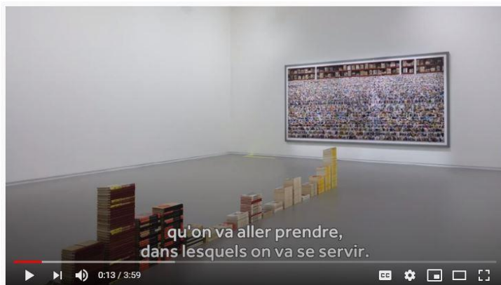
Exposition "Le supermarché des images" | Interview du commissaire Peter Szendy

Nous habitons un monde de plus en plus saturé d'images. L'art et les images sont partout, sur les écrans en tout genre, sur les réseaux sociaux. Comment les contrôler, comment les stocker et gérer leurs échanges ?