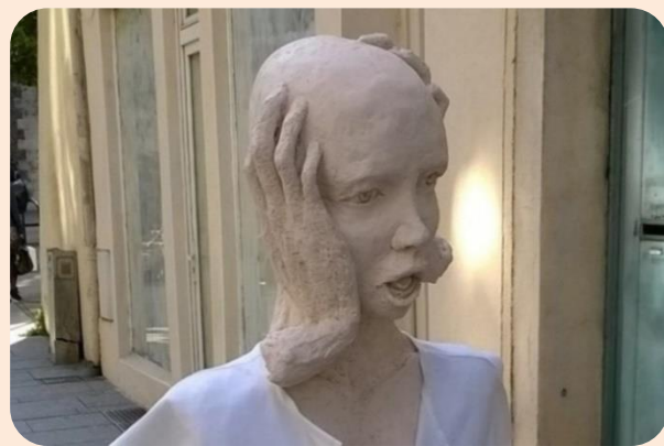
Sculpture de Dominique Grenzinger, Nancy.

Mot très employé dans le langage quotidien, surtout dans la formule « il est fou », ce qui désigne, à tour de rôle, démesuré, inconscient voire irrationnel. Et c'est ici que l'on va s'arrêter : la folie a été catégorisée comme irrationnelle durant les siècles passés, jusqu'à être vue différemment à partir de la fin du 19 e siècle. Même si l'on continue aujourd'hui, dans la perception courante, à considérer que ce qui n'est pas cohérent, logique et rationnel comme étant plutôt fou. La folie fait peur, et de ce fait, elle a été envisagée pendant longtemps comme étrange et anormale. Mais depuis que la psychologie s'en est emparée, elle tente de comprendre la ou les « logique(s) » de ce qui semblait être irrationnel. Allant même plus loin, et prenant modèle sur la pathologie médicale, la psychologie va s'évertuer à classer les troubles et les maladies en différentes catégories qui n'existaient pas auparavant. C'est avec les connaissances en psychologie et en psychanalyse que l'on va mieux comprendre cet univers qu'est la folie.