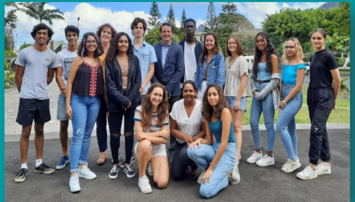
Les délégués de Première