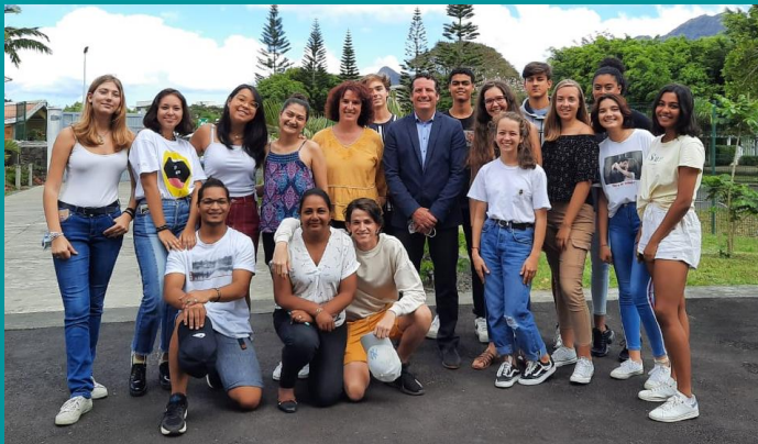
Les délégués de Terminale