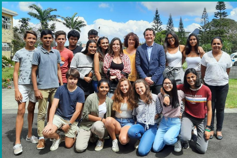
Les délégués de Seconde