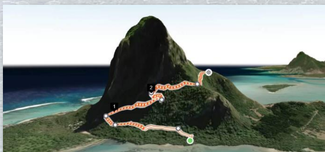
Le segment du Morne (novembre)