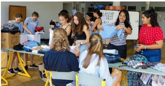
Page réalisée par le COPIL LDM et le Club environnement

Le club environnement du LDM est engagé dans la mise en place des actions portant sur des thématiques environnementales aux côtés des éco-délégués. Ce trimestre, l'action phare du club a été l'organisation d'un vide-dressing au sein du lycée. La présidente du Club nous en dit plus sur cette action. "D'une pierre deux coups! Cette levée de fond promeut la politique du seconde main qui limite la surconsommation. L'argent récolté financera le projet de mini forêt qui consisterait à planter des arbres dans l'enceinte du lycée afin de participer à réduire notre empreinte carbone".