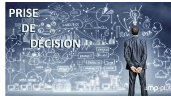
Accompagner la prise de décision