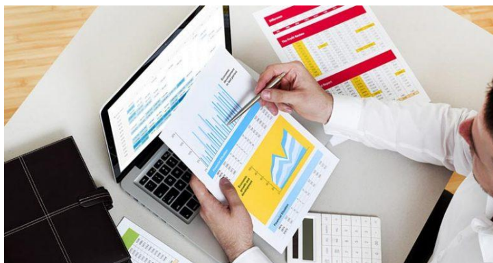
Interpréter les chiffres

Contribuer à la gestion de l'organisation